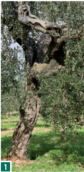
1 Olive – eine von über 140 Holzarten, die zur Verfügung stehen.