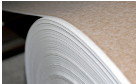
Seit 2009 produziert Schorn & Groh in Eschelbronn Furnierverstärkungsmaterialien.