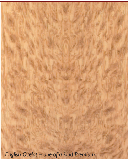
English Ocelot – one-of-a-kind Premium

Das Kernholz hat aus nicht erklärbaren Gründen eine rege und gezackte Ausprägung.