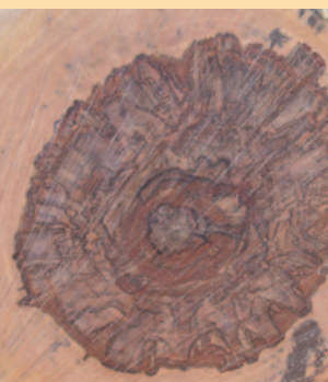
Satin Walnut Stamm und Furnier